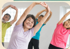
スタジオプログラム