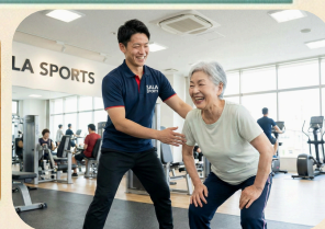
初心者も安心! スタッフサポート